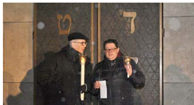
2015.02.02. Lichterkette Jakobsplatz